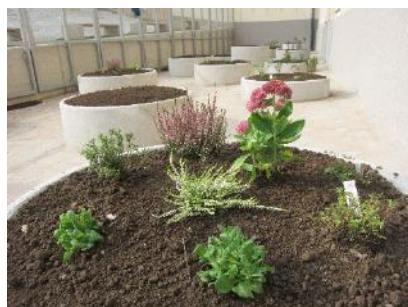
sanirano prednje dvorišče 2018

Leta 2017 sta bili obe zgradbi (šola in telovadnica) energetsko sanirani, telovadnica je dobila popolnoma novo opremo. Delo v obnovljenih prostorih zagotavlja pogoje za bolj zdravo delo. Poleti 2018 je bilo sanirano prednje dvorišče, poleti 2019 za zadnje dvorišče/igrišče za šolo.