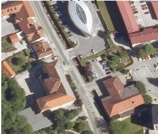
Pogled na okolico šole iz zraka

Učenci v šolo prihajajo peš, s šolskim avtobusom ali z osebnim prevozom (starši, stari starši); dosledno spoštujejo pravila Prometno varnostnega načrta OŠ Ivana Cankarja Trbovlje .