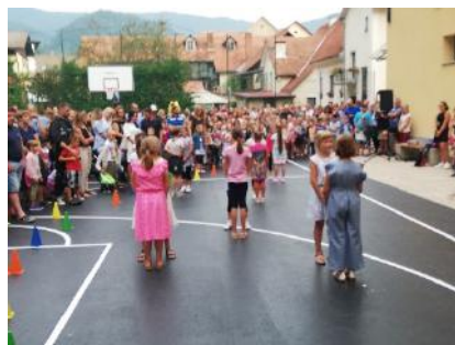
sanirano igrišče za šolo 2019