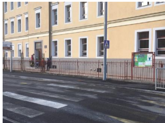
Urejen in varen prehod za pešce pred šolo

V šolski stavbi je petnajst učilnic, štiri specialne učilnice (za naravoslovje, tehniko, gospodinjstvo in računalništvo), knjižnica, razdelilna kuhinja, telovadnica in štirje poslovni prostori. Razen dveh, so vse učilnice brez kabinetov. V šoli ni kuhinje, je le razdeljevalnica hrane, ki je potrebna obnove. Telovadnica se uporablja vse dni v tednu (dopoldan pouk, popoldan in konci tedna zunanji uporabniki -večinoma lokalna športna društva po dogovoru z ustanoviteljem, Občino Trbovlje).