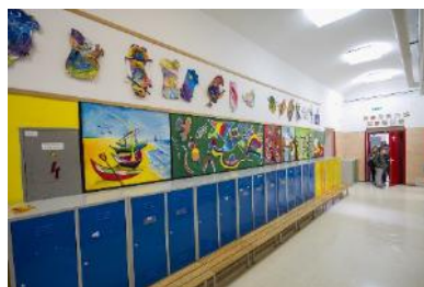
hodnik v pritličju